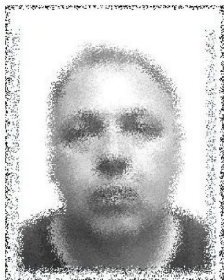
место для фотографии

Согласие на обработку моих персональных данных действует с даты его подписания, до окончания срока действия выдаваемой (заменяемой) тахографической карты. Я уведомлен(а) о своем праве отозвать настоящее согласие в любое время. Отзыв производится по моему письменному заявлению в порядке, определенном законодательством Российской Федерации.